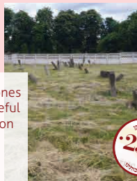
Tombstones in shameful condition

By the grandchildren there is great inspiration to donate generous sums to erect all tombstones in an honorable fashion