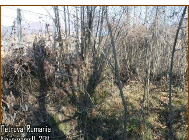
ביה"ח שטארק באוואקסן; אן א דויערהאפטגיגען גדר