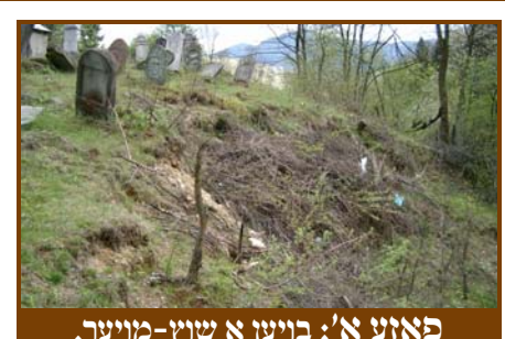
פאזע א': בויען א שוץ-מויער.

צו נעמען א חלק אין די הוצאת לטובת דעם בנין הגדר און תיקון המצבות ביטע רופט 718-640-1470 עקסט. 303, אדער די וועד יוצאי העיר.