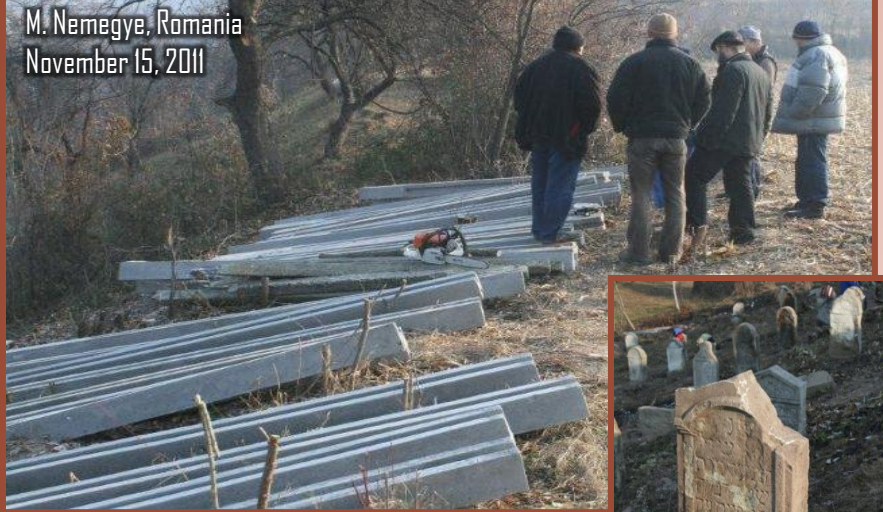
M. Nemegey, Romania November 15, 2011

בנדבת האחים הח' קאפעל הי"ו - משפ' פריעד הי"ו - משפ' גליק הי"ו