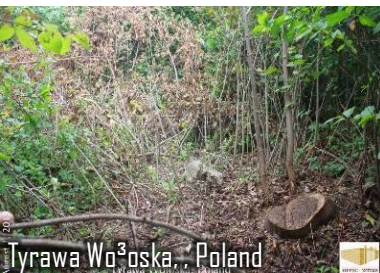
Tyrawa Wołoska - Poland

הערכת שומא פארלאנגט דורך הרב לייבוש הורוויץ שליט"א